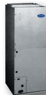
Канальный внутренний блок FB4BSF